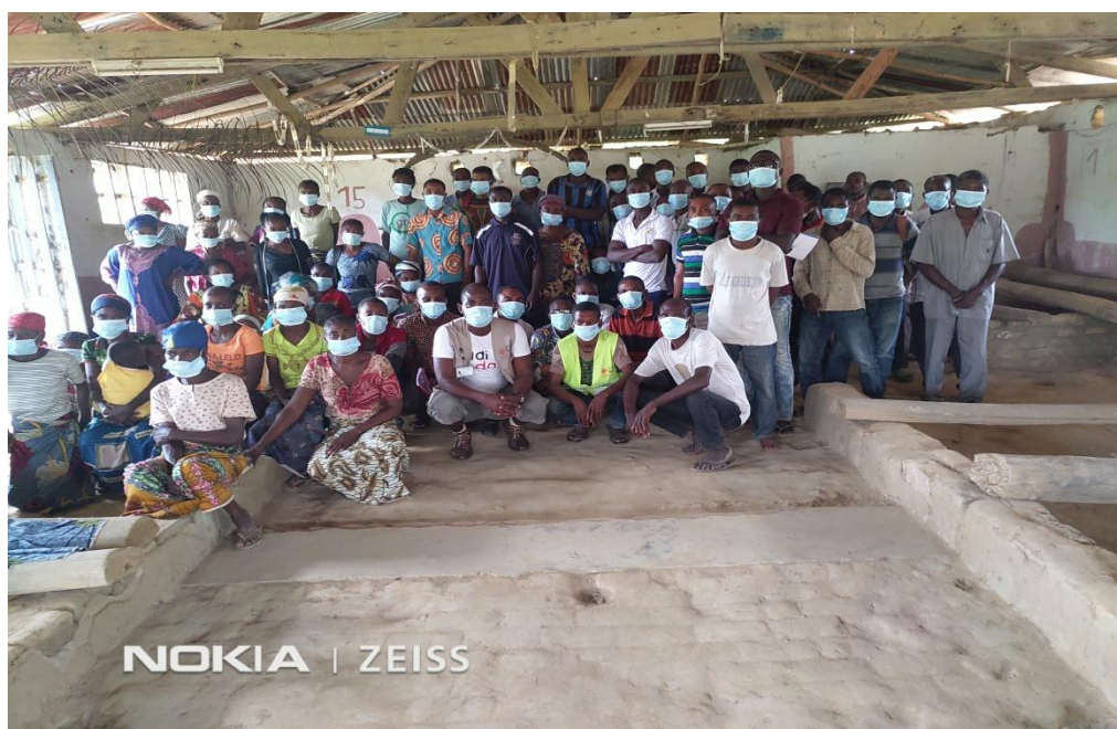
Photo de famille avec les participants à la sensibilisation